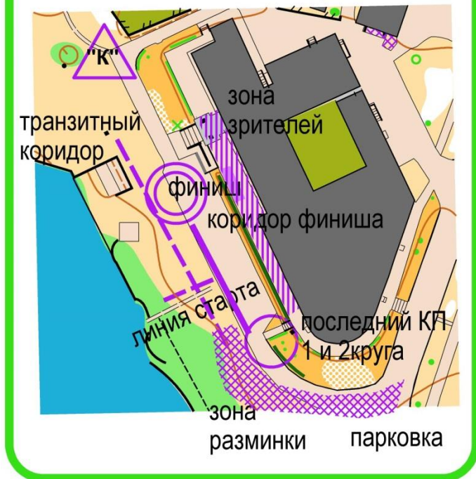
Схема арены соревнований 16.05.2017 Студенческая улица, 5/1 N 58.537941, E 31.290979