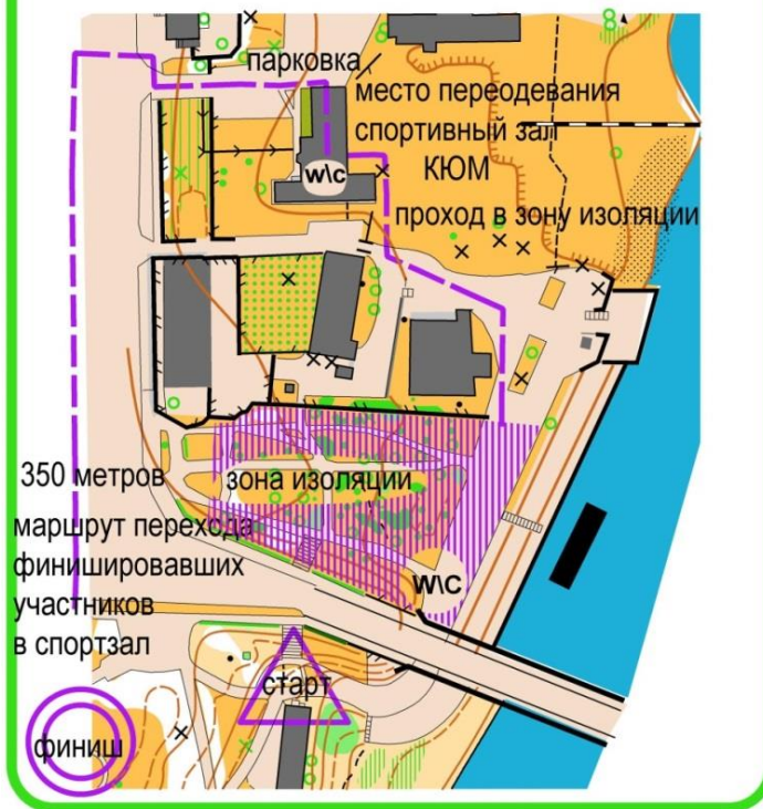
Схема арены соревнований 15.05.2017 Большая Московская улица, 19 к1 гост. "Россия" N58.516458, E31.284159